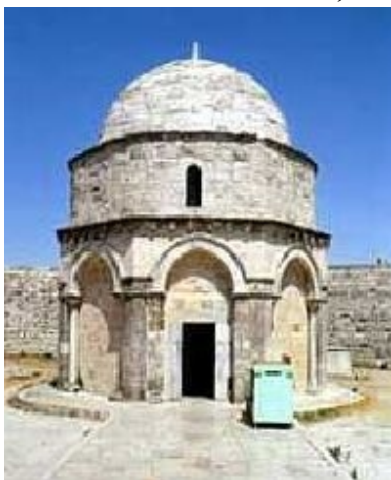
Место Вознесения на Елеонской горе

Вознесшись на небо, Господь не оставил землю Своим Божественным