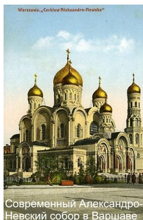
Современный Александровский собор в Варшаве

Турковицы, где после 90-летнего перерыва вновь зазвучала молитва “Пресвятая Богородице, спаси нас!”.